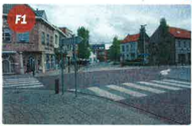
Gemeentepiaats Een druk kruispunt en geen fietspad. Opletten geblazen!