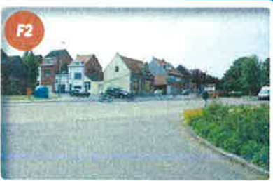
Vijfarmig kruispunt Kijk uit naar alle kanten!